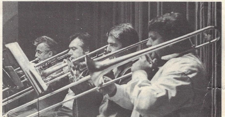
und bei den Posaunen