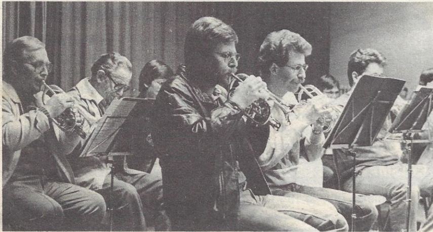
Volle Konzentration bei den Cornets

Erscheint freitags. Herausgeber: Verlags-Gemeinschaft Lindenberg/Seetaler, 5616 Meisterschwanden, Tel. 057 / 27 12 28. Offizielles Publikationsorgan der Gemeinden Aesch, Bettwil, Boniswil, Egliswil, Fahrwangen, Meisterschwanden, Sarmentorf, Schongau, Seengen