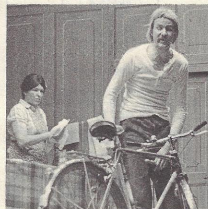
Sicher ist sicher