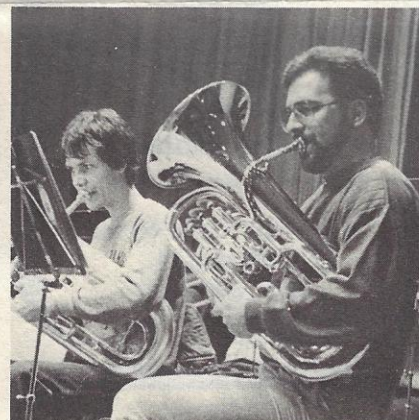
Man hört es förmlich Klingen